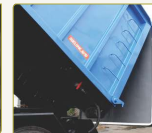
Cửa sau thùng chứa