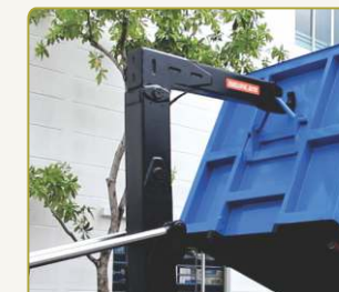
Hệ thống nâng hạ