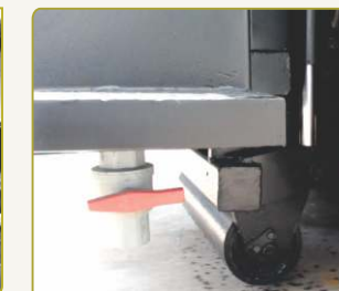
Chân chống tăng tính ổn định